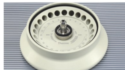
▶ 24 × 1.5/2.0 mL 转头，带 ClickSeal 防生物污染转头盖