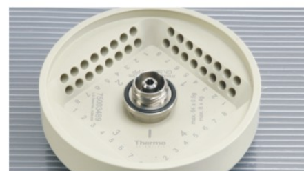
▶ PCR 8 × 8 八联管转头，带旋口盖