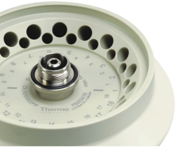
独特的双排管转头无需适配器 可同时离心1.5&0.5ml 微量离心管

Thermo Scientific Heraeus Pico & Fresco 微量离心机结合了强大的离心性能、优异的离心多用性和良好的人机工效设计。其结构精巧、使用方便，同时兼具卓越的产品安全性。Heraeus® Pico® 系列为通风型，Heraeus Fresco® 系列为冷冻型，可为您的微量样品提供快速、安全、有效的分离。其离心容量可满足通常实验室的通量要求。