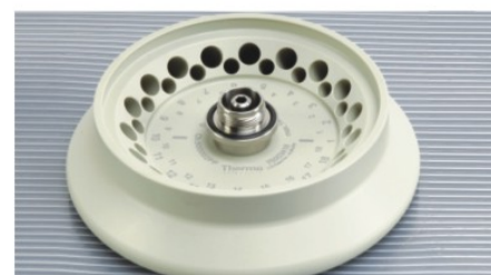
▶ 双排管 18 × 2.0/0.5 mL 转头，带旋口盖