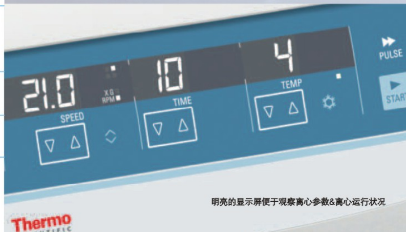
明亮的显示屏便于观察离心参数&离心运行状况