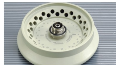
▶ 36 × 0.5 mL 转头，带旋口盖