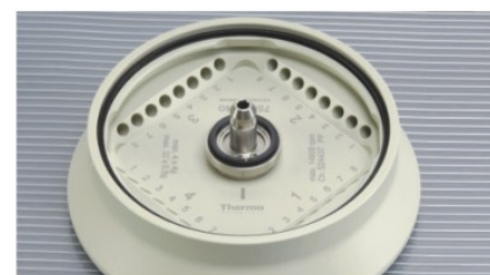
▶ PCR 4 × 8 八联管转头，带 ClickSeal 防生物污染转头盖